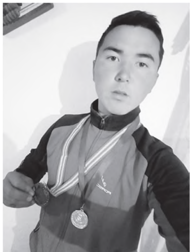
УЛАНОВ БАЯСТАН, И. АРАБАЕВ АТЫНДАГЫ КМУНУН ЧЫГЫШ ТААНУУ ЖАНА ЭЛ АРАЛЫК МАМИЛЕЛЕР ФАКУЛЬТЕТИНИН 1- КУРСУНУН СТУДЕНТИ: